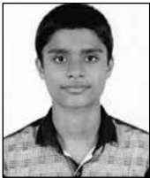
ക്രിസ്റ്റോ മിനു സെന്റ് മേരീസ് കോടുകുളങ്ങരി വേദവാക്യം ഭദ്രാസനം 2nd